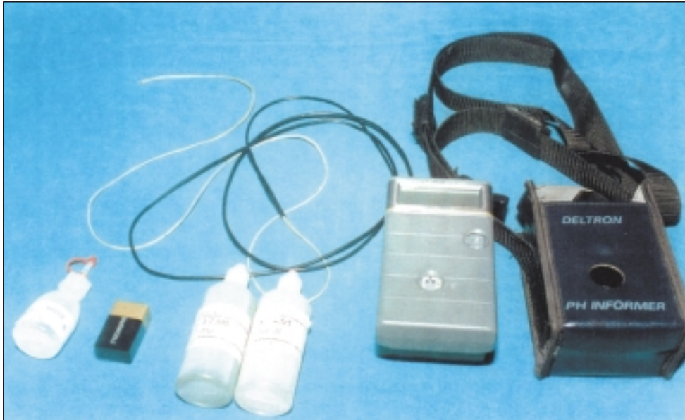
Resim 1. Çalışmada kullanılan, 24 saatlik pH monitörizasyonu sağlayan cihaz ve probalar.

pH probu, pH monitörizasyonu eşliğinde nazogastrik sonda gibi nazofarenks ve özofagus boyunca ilerletilirken pH'nın dördün altına ani düşüşü gastroözofageal sfinkterin geçildiği bölge kabul edildi. Prob bu bölge-